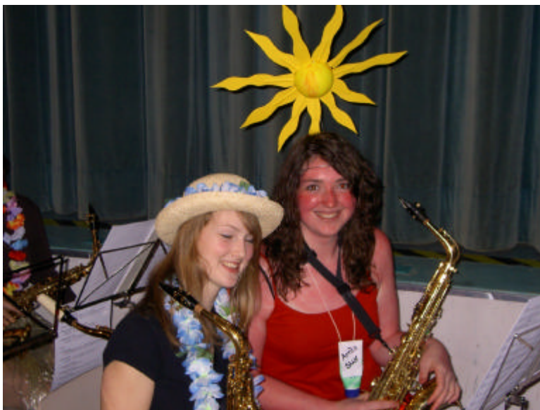
Sommer, Sonne, Strand und Meer und dazu ein Cuba Libre