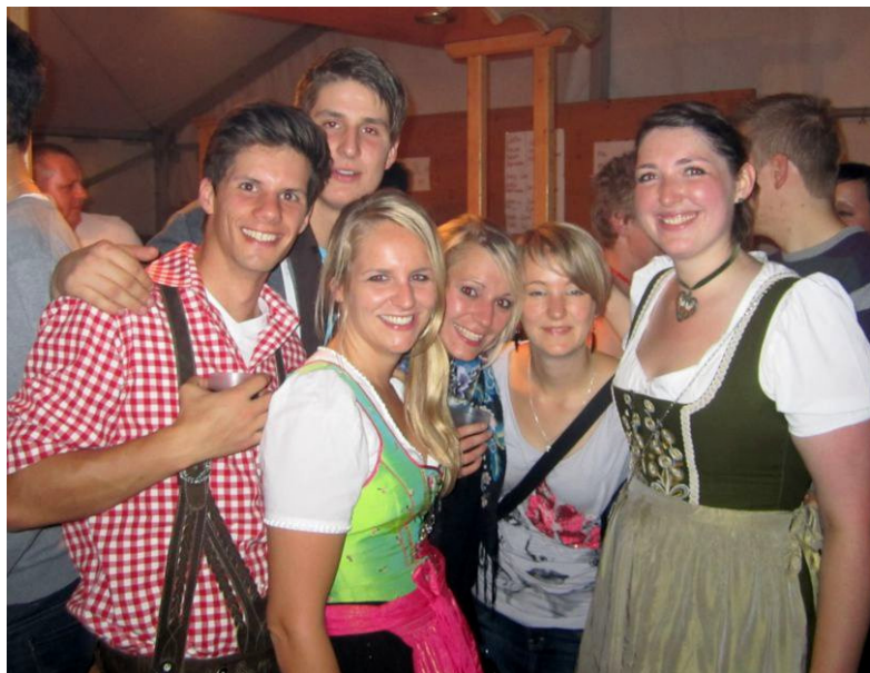
Eine super Stimmung herrschte im Festzelt beim Musiker- ausflug nach Niederstetten.

Am 24. September startete der Bus zu unserem diesjährigen Ausflug nach Niederstetten. Unterwegs machten wir zuerst im Besucherbergwerk "Tiefer Stollen" in Wasseralfingen bei Aalen Halt. Bei der Ankunft stärkten wir uns mit einem Vesper.