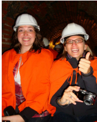
Gut ausgerüstet geht's ins Bergwerk