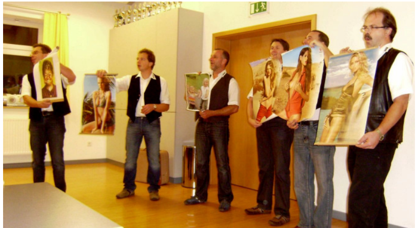
Gehöröl mit ihren „Girls, Girls, Girls“ und als „Wikingerr“

dung gefolgt waren. Belohnt wurden alle mit einem guten Essen. Für großartige Unterhaltung sorgte in diesem Jahr wieder "Gehöröl". Auch eine amüsante Quizrunde sorgte für gute Stimmung. (BS)